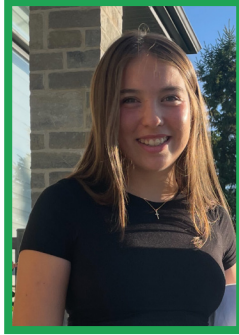
NOIX DE COCO